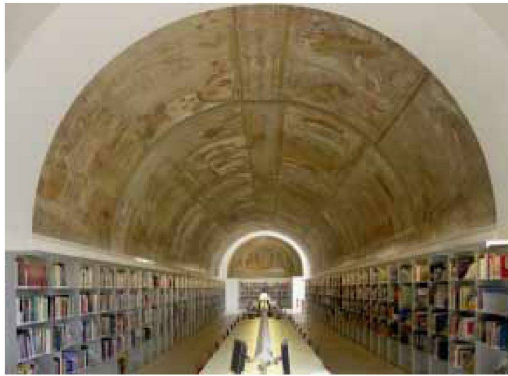
Blick auf die Arbeitsplätze der Bibliothek

Crystal Palace in London gestossen. Es wirkt ebenso deplatziert wie das Modell der Pariser Opéra von 1785 unter den Gipsabgüssen im unteren Geschoss.