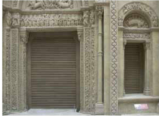
Portal der Prioratskirche Saint-Fortunat in Charlieu: Füllung der Öffnungen