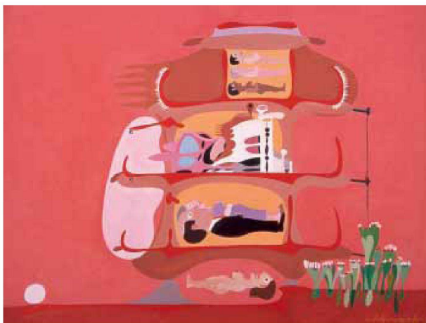
Bilder: Pancho Guedes