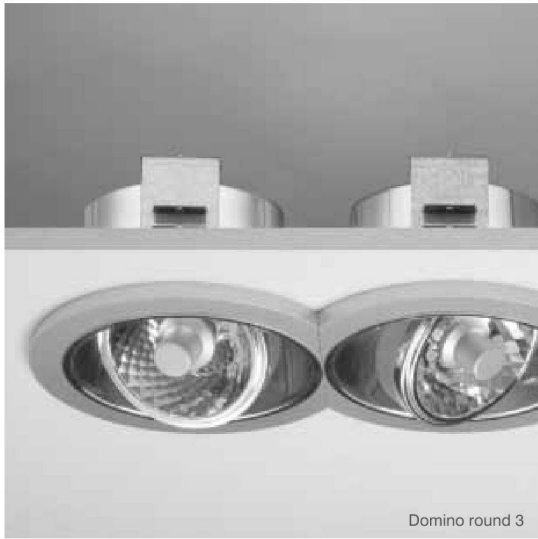
Domino round 3