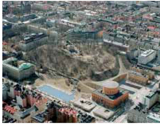
3. Preis, ex aequo: «Dikhörnan», Mauri Korkka Kirsti Rantanen Architects, Helsinki

Als einer der günstigen Plätze wurde Slussen genannt – ein modernistischer Verkehrsknoten an einem wichtigen Wasserweg Stockholms. Slussen wurde einige Jahre nach der Stadtbibliothek gebaut und bedarf sowohl bau- als auch verkehrstechnisch einer totalen Erneuerung. Bei einer solchen Lösung könnte die alte Stadtbibliothek als Filiale für die nördliche Innenstadt dienen. Aber die Wahrscheinlichkeit, dass der Planungsprozess, in den die Stadt Stockholm bereits Tausende