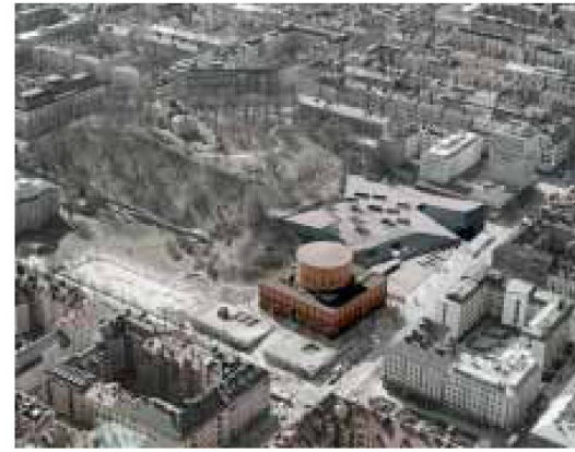
4. Preis, ex aequo: «Blanket», Stephen Taylor Architects, London

durch wächst die Gefahr, dass die Entscheidungen am Ende unter zeitlichem Druck überstürzt werden.