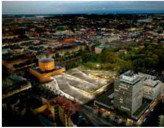
4. Preis, ex aequo: «Book Hill», Yoshiyuki Tanaka, JAJA Architects ApS, Kopenhagen