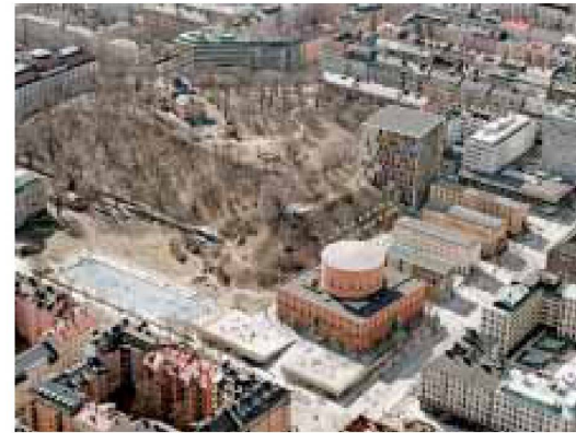
4. Preis, ex aequo: «Nosce te ipsum», Nicola Braghieri, Mailand

Übersetzung: Annina Wanner, original text: www.wbw.ch