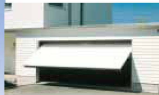
Hartmann öffnet Ihnen Tür und Tor: automatische Garagentore