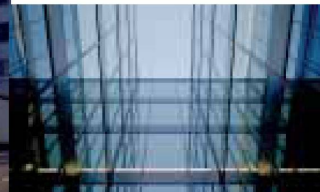
Hartmann setzt visionäre Architektur um: Fassadenbau Hartmann ist immer für Sie da: auch bei Service und Reparaturen