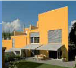
Hartmann bietet Lebensqualität: Sonne- und Wetterschutz