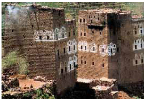
Kreidezeichnungen markieren die Empfangs- und Wohnräume im jemenitischen Sa'adan.