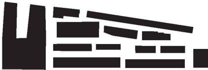
giuliani.hönger ag, dipl. Architekten, Zürich

aus. Dieser Hof soll durch ein «Wohnregal» – auf den Bahnraum ausgerichtete, transparente Wohnungen – von der Bahn einsehbar sein. Ist dieses ausgestellte Wohnen am stark befahrenen Geleisfeld nicht zu forciert? Nebst der Nutzungsmischung ist auch die Ausgestaltung der Erdgeschosse für die Lebensqualität eines Quartiers von grosser Bedeutung. Dabei zeigen Erfahrungen in Neu-Oerlikon, dass Erdgeschosse für öffentliche Nutzungen angepasst geplant werden sollten. Für das Areal Lagerplatz wurde im Gestaltungsplan ein Minimum von 10 Prozent der Geschossfläche als publikumsorientierte Nutzungen festgelegt, jedoch wünscht man sich hier klarere Aussagen über eine, gegenüber den ehemaligen Industrienutzungen durchlässigere Ausgestaltung der Erdgeschosse.