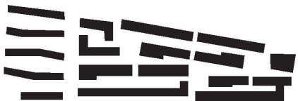
burkhalter sumi architekten, Zürich

Die Ergebnisse der Testplanung und des Gestaltungsplans wurden im April 2008 der Bevölkerung vorgestellt. Mit einer nun laufenden Anpassung der Bau- und Zonenordnung wollen Stadt und Eigentümerinnen das Areal Lagerplatz aus der Industriezone I 2 und der Zentrumszone Z 7 in eine neu geschaffene Zentrumszone Z 5 überführen. Auf der Grundlage des Gestaltungsplans werden die Verkaufsgespräche der Eigentümerinnen mit der Stiftung Abendrot und anderen Kaufinteressenten weitergeführt.