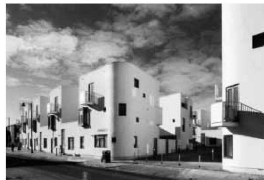
London, Donnybrook Quarter in Bow (Tower Hamlets). Wohnüberbauung von Chris Barber, 2006

Entstanden ist ein anregendes Panoptikum historischer und aktueller Wohnmodelle für jene anspruchsvollen gesellschaftlichen Gruppen, die es sich leisten können, ihre Wohnform zu wählen.