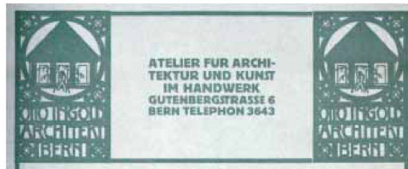
Der Briefkopf des Architekten Otto Ingold, 1913.