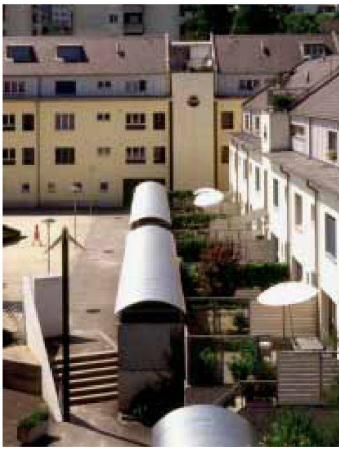
Scheuner Mäder Schild, Wohnbauten Hügelweg in Luzern, Eisenbahner-Baugenossenschaft Luzern 1990–91.