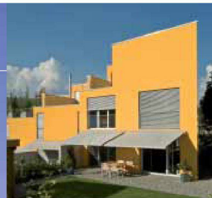
Hartmann bietet Lebensqualität: Sonne- und Wetterschutz