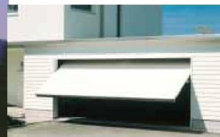
Hartmann öffnet Ihnen Tür und Tor: automatische Garagentore