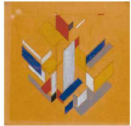
Theo van Doesburg, Maison d'artiste, 1923.

Die Aktualität dieses Gestaltungsprinzips nimmt im Buch zu Recht viel Raum ein. Besonders interessant sind die Ausführungen zu den hybriden Boden-, Wand- und Deckenflächen, da sich bei diesem anfangs der 90er Jahre etablierten Topos erstmals die Flächen zu krümmen und biegen begannen, wodurch die klassische Unterscheidung in horizontale und vertikale Elemente – wie sie dem berühmten Schema der Maison Dom-Ino (1914) von Le Corbusier eigen ist, hinfällig wurde. Die als «Folding Architecture» bezeichnete Strategie hat nichts weniger als die Neuerfindung der Architektur zum Ziel, die allerdings, wie Ulama zu Recht anmerkt, zu qualitativ unterschiedlichsten Ergebnissen führt. Denn was in virtuellen Darstellungen funktioniert, lässt sich mit den heutigen Mitteln erst ansatzweise verwirklichen. Bauten von OMA und UNStudio etwa zeugen