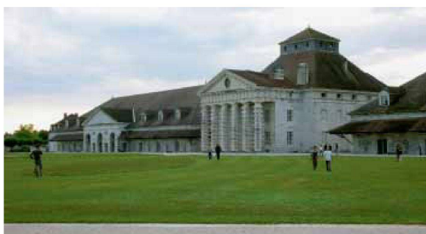
Echo im Innenhof («Stereos» von Ivan Etienne) und Installation in der Remise des Direktors («Shapes for Statics» von Brice Jeannin) in Arc-et-Senans

Faire une ambiance, Grenoble, 10.–12. September 2008: www.cresson.archi.fr/AMBIANCE2008.htm