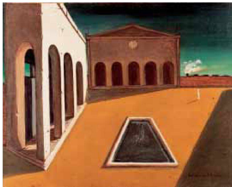
Giorgio de Chirico (1888–1978), Les plaisirs du poète , 1912.