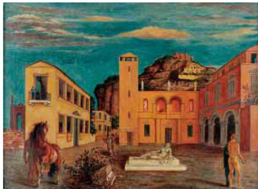
Giorgio de Chirico (1888–1978), Paesaggio romano , 1922.

In der Tat: Zwischen metaphysischer Malerei und Architektur besteht eine tiefgründige Affinität. Schon der Künstler selbst meinte 1919 zu dieser Wesensverwandtschaft: «Die ersten Grundlagen einer metaphysischen Ästhetik finden wir im Städtebau, in der architektonischen Gestalt der Häuser, auf den Stadtplätzen, in den Gartenanlagen und auf den Promenaden, in den Häfen, auf den Bahnhöfen. Die Griechen, geleitet von ihrem ästhetisch-philosophischen Geist, verwandten Sorgfalt auf derartige Bauten: Auf den Portikus, die schattigen Säulengänge, auf die Sitzstufen, die sich wie ein Parterre vor den grossen Schauspielen in freier Natur aufbauten (Homer, Aischylos). In Italien besitzen wir moderne und bewundernswerte Beispiele solcher Bauweise.» 1 Es sind denn auch diese vom Maler angeführten Elemente der Stadt, denen der Blick in seinen metaphysischen Gemälden in immer neuen Variationen begegnet: menschenleere Plätze, lange schattige Kolonnaden, Industrieschlote und Türme, Segelschiffe als Hinweis auf einen nahe liegenden Hafen, Eisenbahnzüge – und generell der Eindruck, statt auf eine reale Stadt auf ein szenografisch arrangiertes Ensemble, ein Bühnenbild (im Sinne vielleicht gar der griechischen Tragödie?) zu schauen.