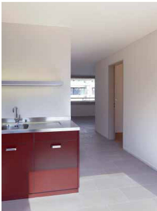
Küche und Wohnraum verschränken sich über das Entrée in einer Z-förmigen Raumfigur

dieser Nachbarschaft noch weitere Antworten zu Fragen nach öffentlichem und privatem Raum, etwa in einer gemeinschaftlichen Nutzung des Erdgeschosses oder einer spezifischen Gestaltung der Zeilenenden zum Strassenraum hin. Die innenräumliche Adaption des Herumziehens der Fassade um den gesamten Baukörper oder das Drehen der Grundrissausrichtung an den Gebäudeenden könnten hier eine Erwägung wert sein.