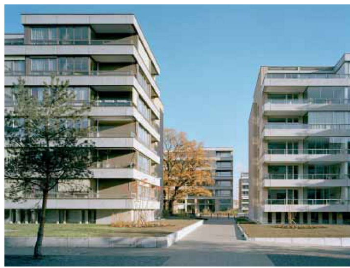
Blick quer zu den Zeilen, rechts die für die CS realisierte Variante