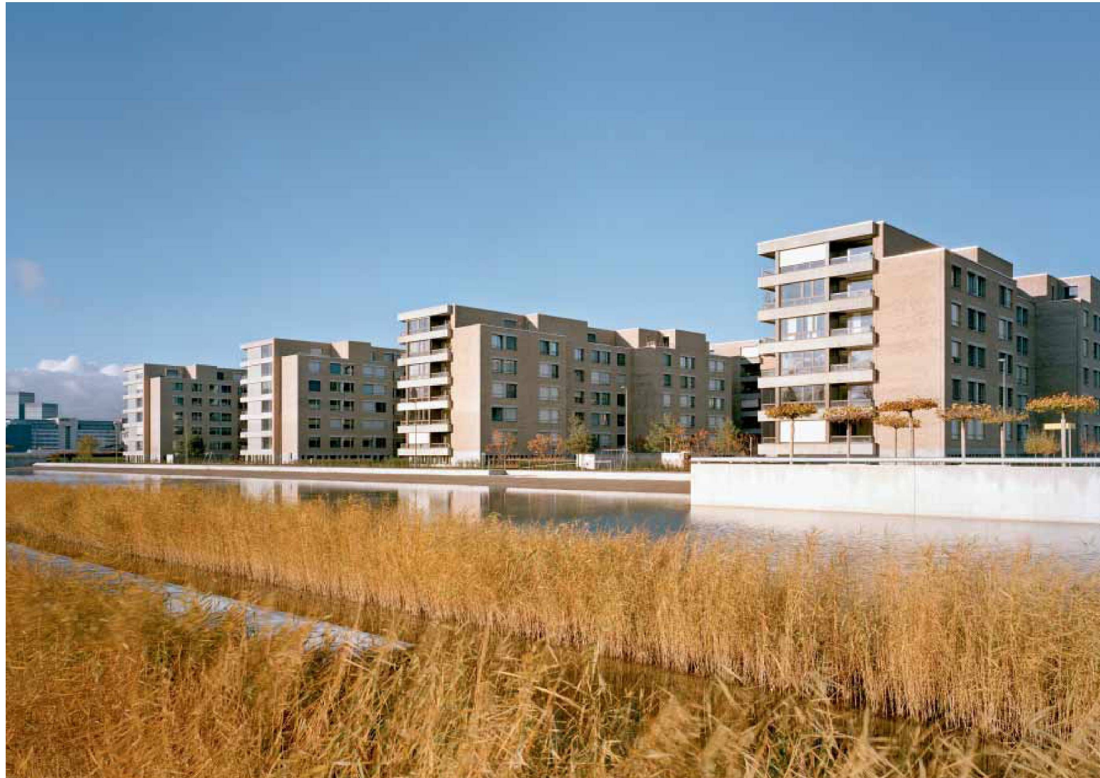
Blick vom Park aus, links die für die CS erstellten Bauten