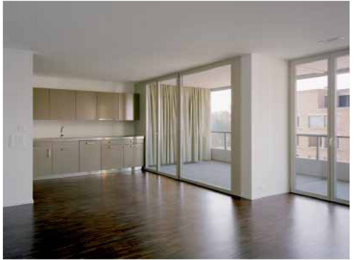
Wohnung des für die CS realisierten Typs