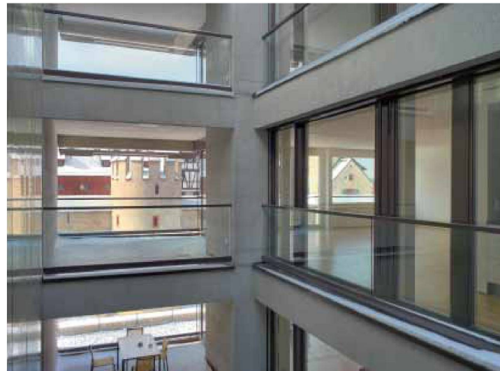
Blick durch das Atrium auf die Stadtmauer