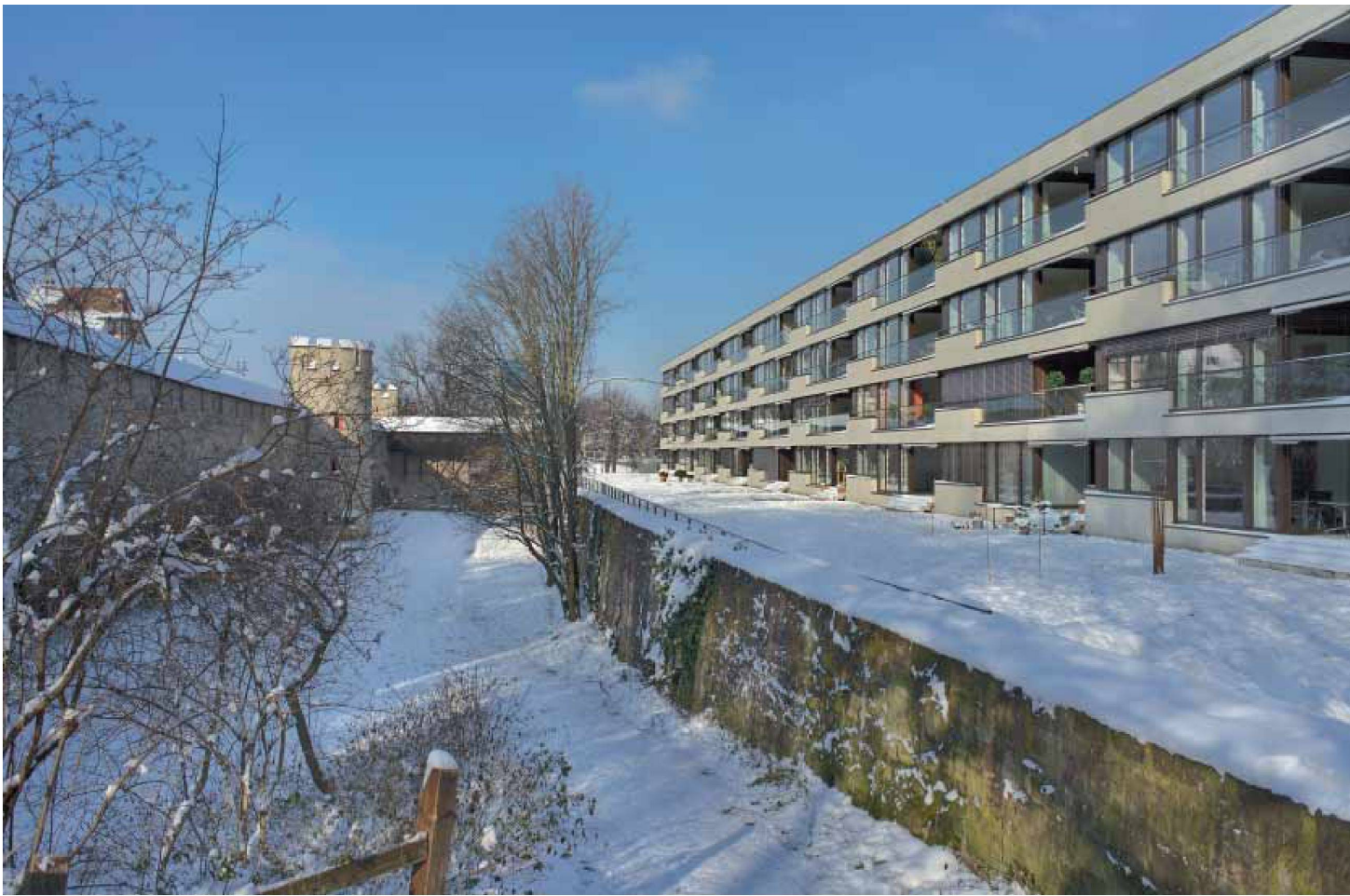
Gartenseite zur Stadtmauer