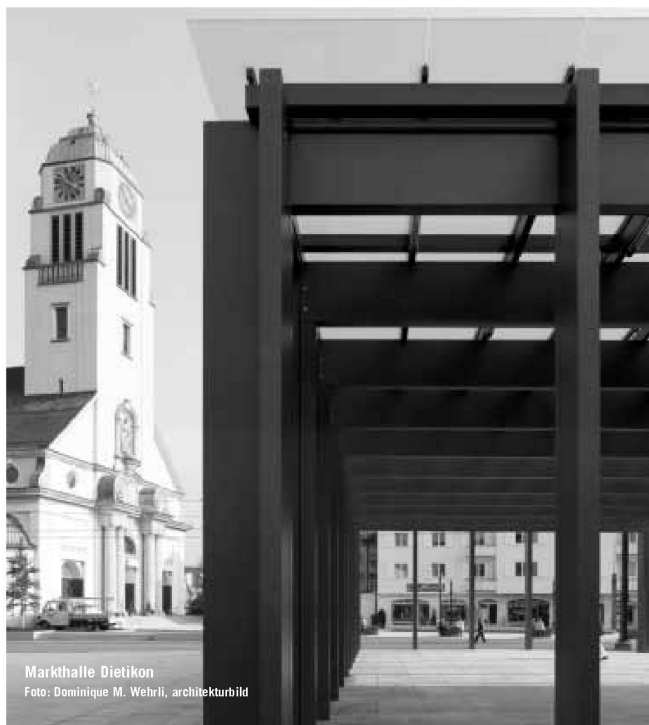
Markthalle Dietikon

Partner für anspruchsvolle Projekte in Stahl und Glas