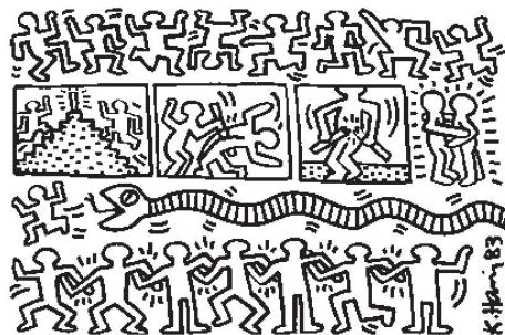
Keith Haring, Ohne Titel, Tinte auf Polystyrol, 1983, Haggerty Museum of Art, Milwaukee. – Bild: Haring Artwork © Haring Estate