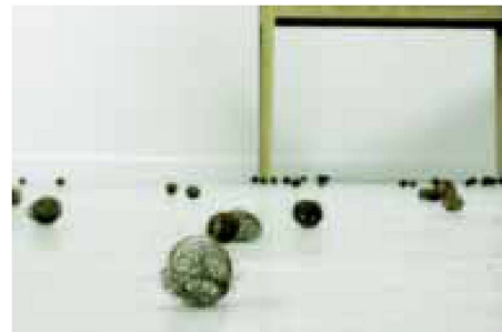
Mona Hatoum, Recollection, 1995, Museum van Hedendaagse Kunst Antwerpen

wollten, ist das Archaische nichts, was lediglich in eine Frühzeit der Kultur gehört, ja was Schritt um Schritt – endgültig – überwunden werden könnte. Im Gegenteil fällt auf, dass gerade Epochen, in denen vieles etabliert und daher elaboriert ist, auch besondere Bedürfnisse nach Archaischem entwickeln. Hätte Nietzsche darin noch eine Variante des dionysischen Triebs erkannt, der sich allen apollinischen Sublimierungen widersetzt, so würde man heute wohl eher vermuten, dass Archaisches eine Überzivilisierung kompensieren soll und als Verheißung in einer Welt auftritt, die in vielen Bereichen als ausbuchstabiert und reglementiert, eben deshalb aber auch als entfremdet empfunden wird.