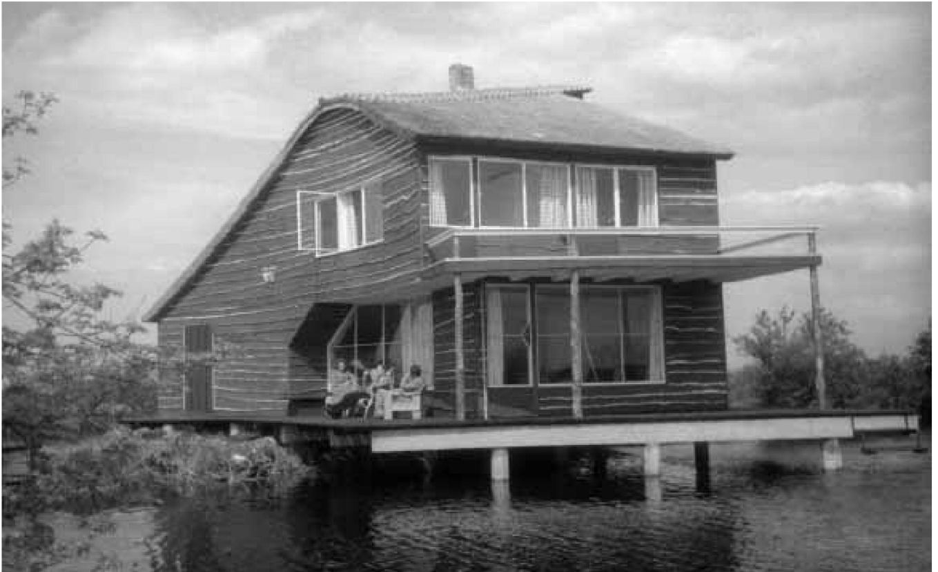
Diese historischen Bilder von Nico Jesse befinden sich im Nederlands Fotomuseum