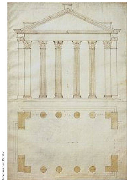
Andrea Palladio, Grundriss und Aufriss des Portikus der Otavia in Rom, nach 1550

Ausstellung «Andrea Palladio: His Life and Legacy», Royal Academy of Arts, London, bis 13. 4. 2009. Katalog herausgegeben von Guido Beltrami und Howard Burns für £27,95 (Softcover). Weitere Stationen der Ausstellung: Caixaforum Barcelona, 19. 5.–6. 9. 2009; Caixaforum Madrid, 6. 10. 2009–17. 1. 2010.