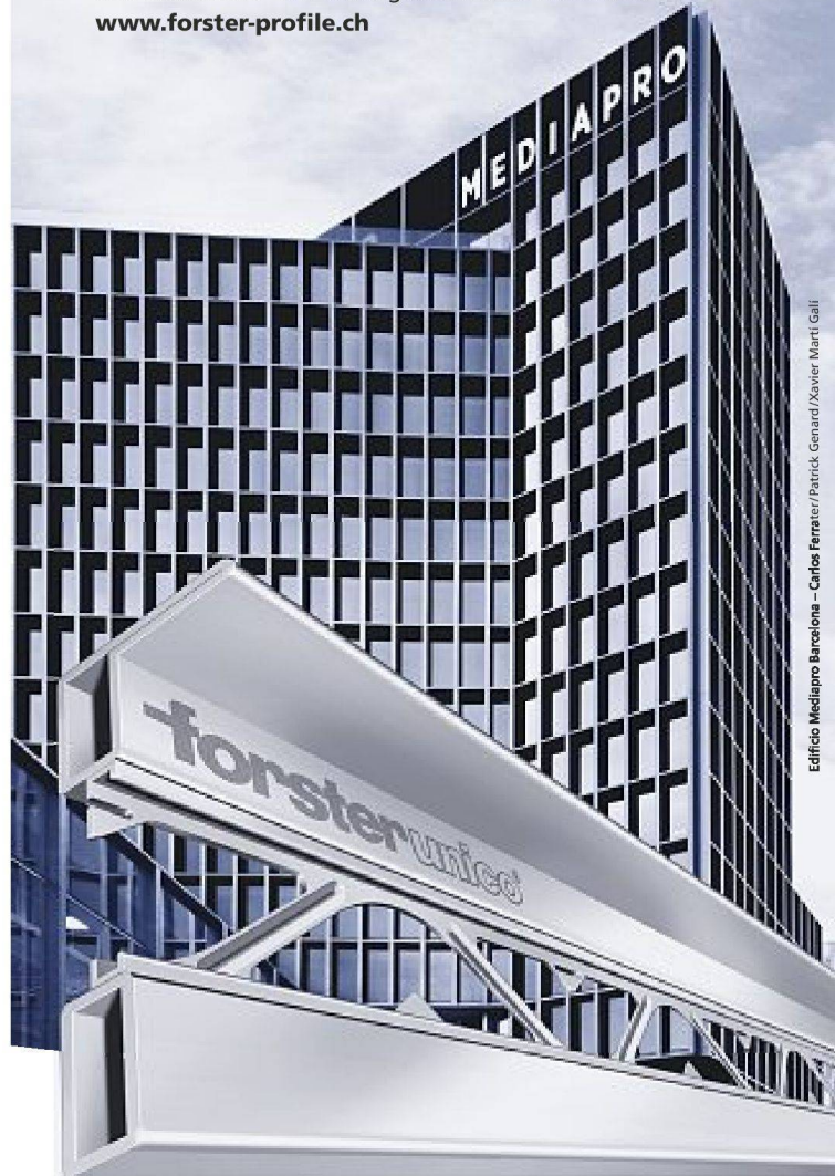
Edificio Mediapro Barcelona – Carlos Ferrater/ Patrick Genard/ Xavier Martí Galí

Im neuen Mediapro-Gebäude der spanischen Architekten Carlos Ferrater, Patrick Genard und Xavier Martí Galí steckt nicht nur ein geniales Auge für den perfekten Winkel. Sondern auch das weltweit erste, zu 100% aus Stahl gefertigte Profilsystem für wärmedämmte Fenster, Türen und Abschlüsse: Forster unico . Seine einzigartig schlanken Profilschnitte erlauben eine völlig neue Form von Ästhetik und Kreativität – bei aussergewöhnlicher Stabilität. www.forster-profile.ch