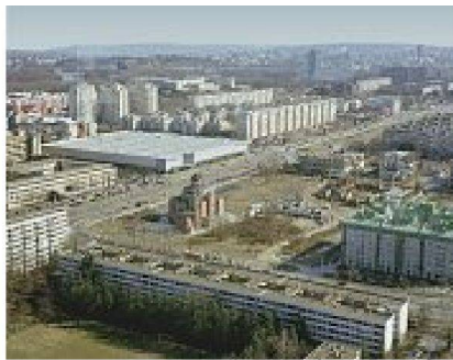
Formelle und informelle Bauten in Belgrad