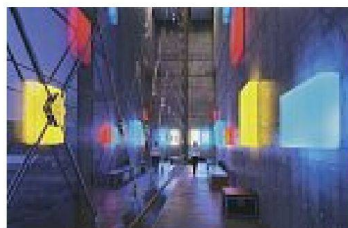
Bilder: T. Petersen