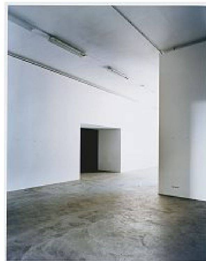
Bilder: Candida Höfer