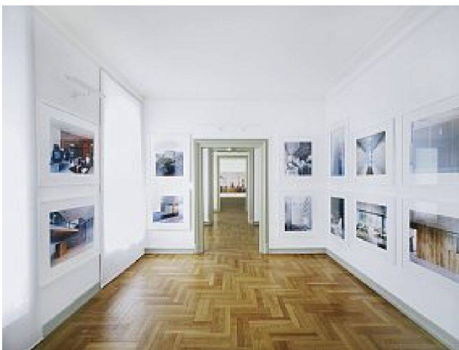
Blicke in die Ausstellung im Schloss Morsbroich: Bilderserie zur Niederländischen Botschaft (links) und die Lauder Business School Wien.

Die Publikationen «Candida Höfer. Projects: Done» und «Candida Höfer. Kuehn Malvezzi» sind im Verlag der Buchhandlung Walther König erschienen.