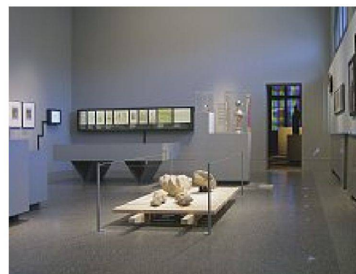
Katholisch-purpur (oben) und protestantisch-grau in der Ausstellung «Geschichte Schweiz» im Obergeschoss