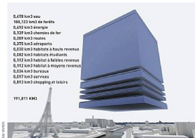
Urbane Dichte, statistisch dargestellt von MVRDV.