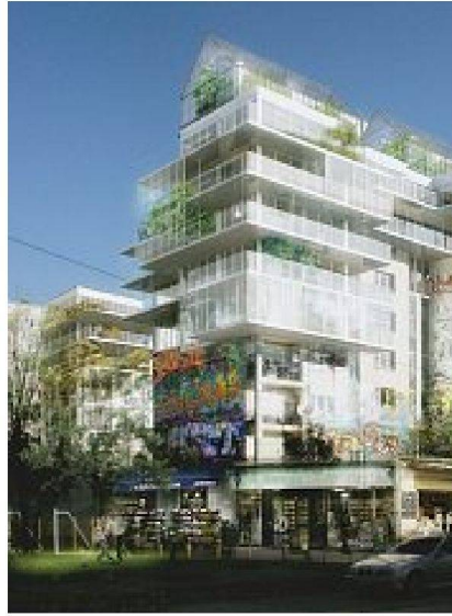
Aufwertung desolater Wohnblöcke zu vertikalen «Eco-Quartiers», ebenfalls von Jean Nouvel

«Morphogenetische Perspektiven – Die Stadt als lebendiger Organismus» zeigte die Konzeption der Stadt als ein organisches, sich ständig veränderndes Gebilde. Jenseits von Massstäblichkeit kontrollieren die «Bio-Tech-Systeme» jedes dynamische Wachstum und generieren ein eigenes, im bisherigen Städtebau unbekanntes Vokabular. Zum Abschluss beleuchtete das Thema «Grenzen des generierten Chaos» hybride Stadterweiterungen, die zusehends unkontrollierbare Systeme generieren. Während sich Kengo Kuma für eine Wiederkehr natürlicher Baumaterialien einsetzt, sieht Thom Mayne (Morphosis) in der Technologie den wahren Fortschritt. Rem Koolhaas kritisierte heftig Frankreichs Politik, den Vorstadtproblemen und Potenzialen den Rücken zu kehren, anstatt sich mit dem Erbe der Moderne intensiv auseinander zu setzen. Er kündigte an, dass er sich nach jahrzehntelanger Beschäftigung mit der Stadt