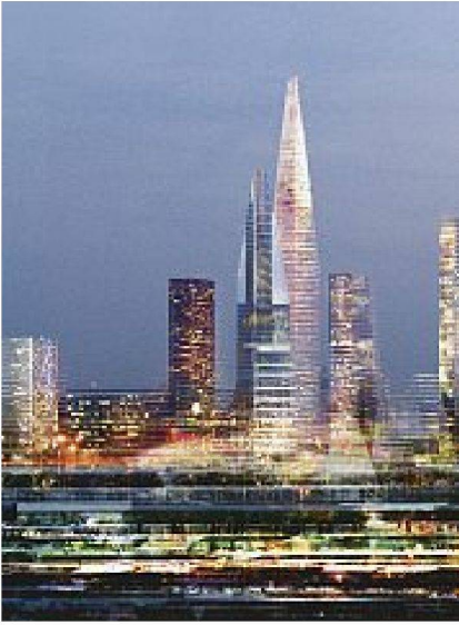
Bilder: Abélès, Jean Nouvel

Verdichtung des gebauten Bestandes von Jean Nouvel, hier im Quartier Genevilliers.