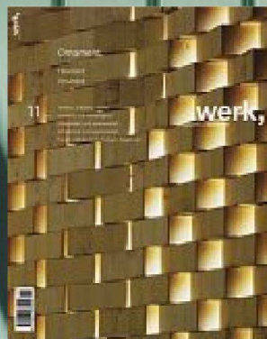
11 | 07 Ornament