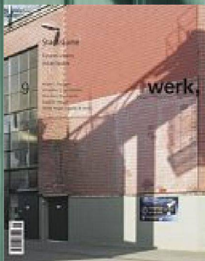
9 | 06 Stadträume