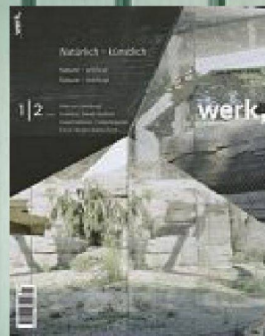
1-2 | 09 Natürlich-künstlich