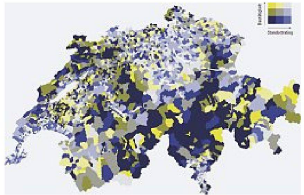
Das Nachhaltigkeitsratingsystem von Wüest & Partner.