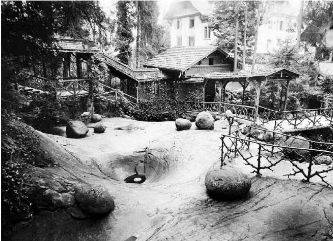
Kleinere Gletschertöpfe, im Vordergrund Gletscherschliff mit geschrammter Oberfläche, nach 1890