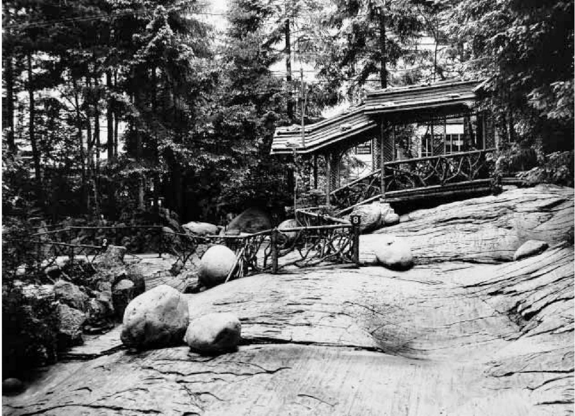
Gletscherschliff mit Findlingen, 1906 (Wehrl No. B. 11766)