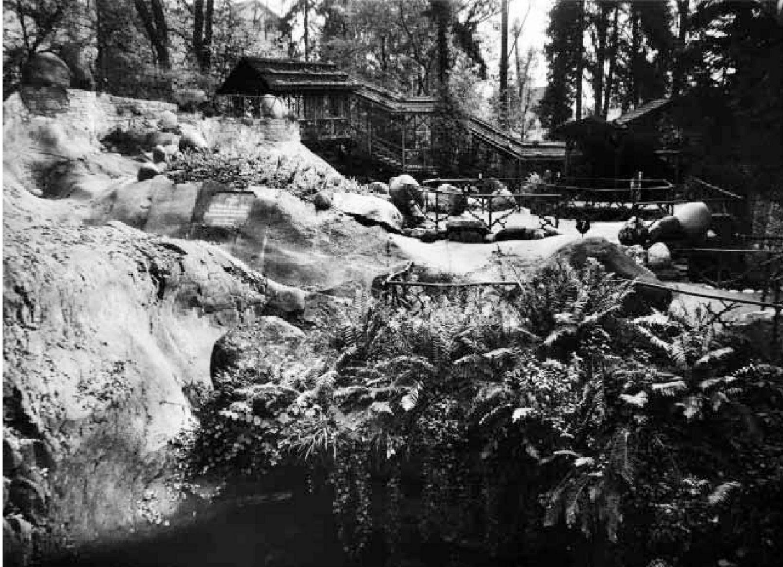
Gletschertöpfe und Findlinge, nach 1930