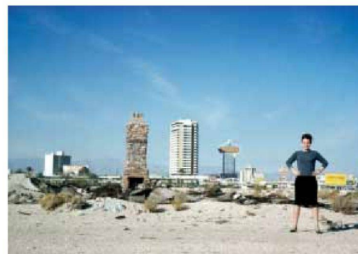
Oben: Erstes Bild aus einer Sequenz, Upper Strip, Fahrtrichtung Nord, Las Vegas, 1968.