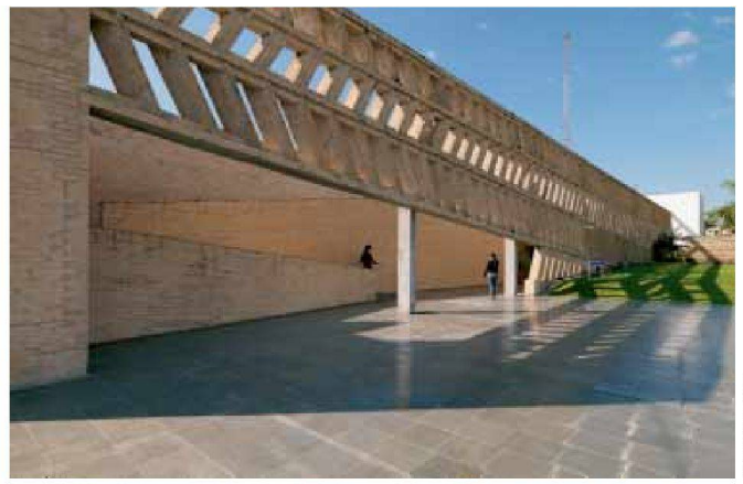
Unilever Firmensitz in Villa Elisa, 2000–2001