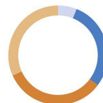
Einkommensgruppen bei jungen Paaren Bis 3000 3001–6000 6001–9000 Über 9000 Quelle: Immo-Barometer NZZ / Wüest & Partner