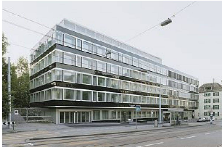
Alt und neu: umgebauter Gebäudeteil der LLB (links), ursprüngliche Fassade von 1971 daneben.