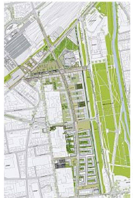
Masterplan des «Quartier de l'Amphithéâtre»

architekten Jacques Coulon und Laure Planchais den 20 000 m 2 grossen «Parc de la Seille» an. Bis 2012 sollen nach dem Gestaltungsplan von Nicolas Michelin – dem Leiter der Architekturhochschule Versailles – auf dem dreieckigen Gelände zwei Baufelder mit gemischter Nutzung entstehen (50 000 m 2 Büro- und 38 000 m 2 Detailhandelsflächen sowie 1 500 Wohnungen). Im April wurde bekanntgegeben, dass der französisch-algerische Architekt Rudy Ricciotti als weiteres kulturelles Highlight einen neuen Konzertsaal erbauen wird. Den weithin sichtbaren Leuchtturm des neuen Quartiers, an der Spitze des Areals in unmittelbarer Nähe zum Bahnhof gelegen, aber stellt «Beaubourg Zwei» dar, das Mitte Mai mit viel Pomp eröffnete Centre Pompidou-Metz.