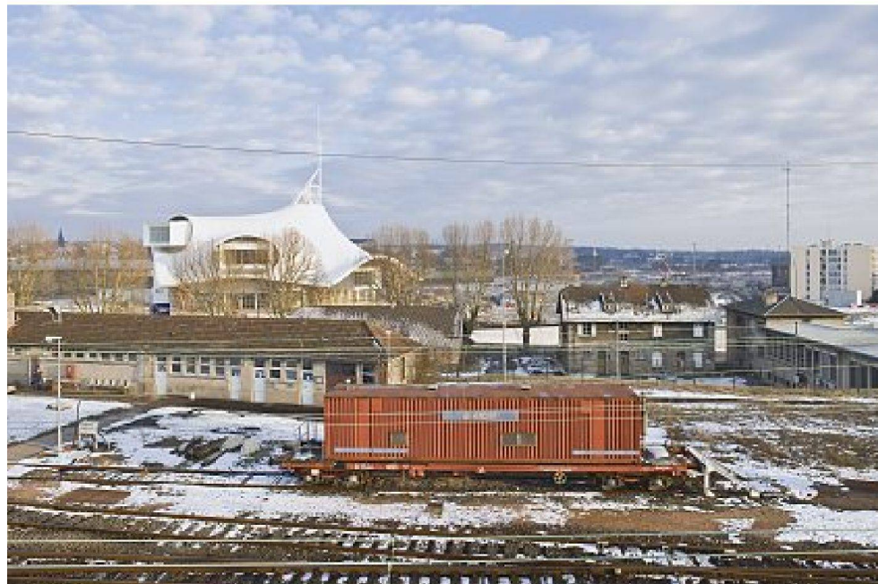
Das Centre Pompidou-Metz liegt strategisch ideal neben dem TGV-Bahnhof.