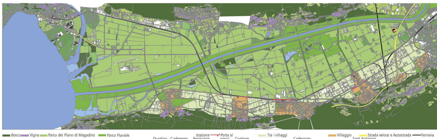
«La Strada del Piano», Projekt für eine Schnellstrassenverbindung A2-A13, Bellinzona-Locarno.

gisch neu zu bewerten. Die Magadinoebene ist ein Naturraum, der im Norden und im Süden von Bergen begrenzt wird. Durch die Ebene zieht sich von Osten nach Westen der kanalisierte Fluss Ticino. Die Eisenbahnlinie bildet im Norden die Grenze des Naturparks «Parco del Piano del Magadino», dessen natürliche und landwirtschaftliche Eigenheiten als Erholungsraum geschätzt und bewahrt werden. Ebenso wichtig ist der Flussraum, der sich als «Parco Fluviale» vom See bis mindestens nach Biasca erstrecken sollte. Klar begrenzt das Trasse der Eisenbahn weiter eine südlich, am Fusse der Berge gelegene, weite Fläche, die sich von Osten nach Westen erstreckt. In diesem Teil