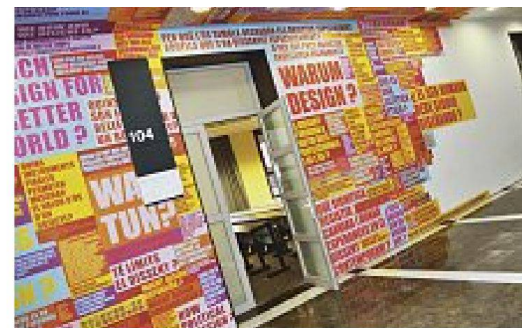
«Design in Question», eine visuelle Kooperation von Design2context mit der Designhochschule Elisava in Barcelona