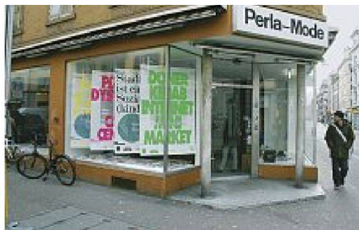
Plakate zum Projekt «Civic City» (Design for the post neo-liberal city) in Zürich