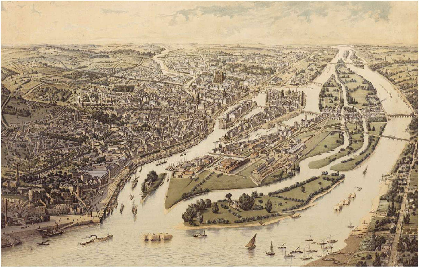
Nantes in der Vogelperspektive, Blickrichtung Ost, Chromolithografie 1886

Das war das Ende einer Geschichte und gleichzeitig der Beginn einer neuen. Nach der Schliessung der Werften war die Ile de Nantes eine teilweise verlassene Insel im Zentrum der Stadt mit einer ehemaligen Werft von 350 Hektaren Ausdehnung, einer riesigen Industriebrache, die zur Umnutzung zur Verfügung stand. Dies stellte eine beachtliche städtebauliche Herausforderung dar, deren Dimension allerdings nur vor dem Hintergrund des beschriebenen historischen Wandels verständlich wird.