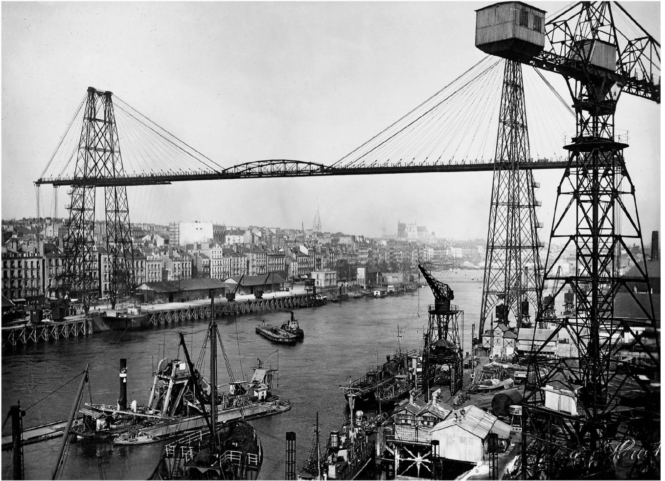
Hafengebiet an einem Flussarm der Loire; die Brücke wurde 1903 erstellt und 1958 wieder abgebrochen.

considerable hinterland, Nantes would have been quite irrelevant as a port. And without its opening towards the Atlantic, there would have been no trade with the West Indies, no sugar trade, no yards, nothing of the "big city" that knew how to seduce so many travellers. In the 17th century, Nantes became the first French slave port. The prosperity of Nantes shows in its neoclassical architecture. In the 18th century, entire districts were built, when the population of the town doubled. In the following century, the town became industrialized around its river and port. In the second half of the 19th century, the sites along the lower Loire built a good quarter of all ships in France. Nonetheless, the town did not escape the historical turning point: the outer harbour of Saint-Nazaire turned into a veritable competitor of Nantes; in fact,