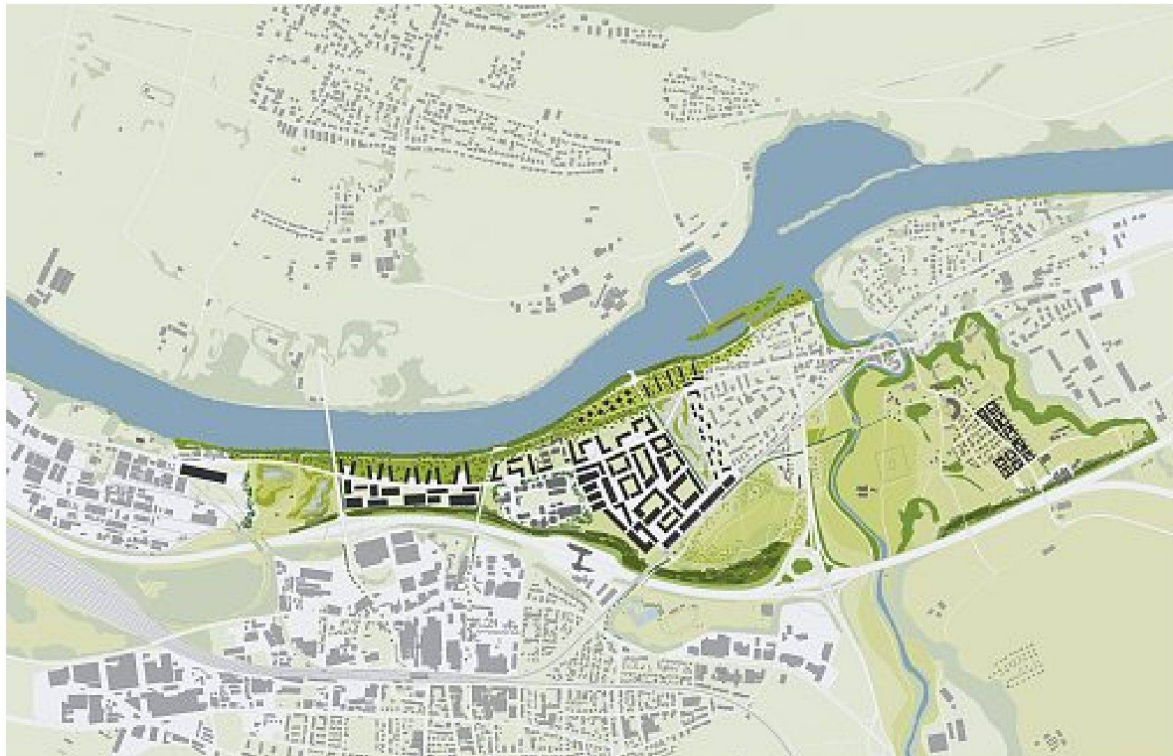
Salina Raurica, Pratteln/Augst: Übersichtsplan. – Auftraggeber: Kanton Basel-Landschaft, Amt für Raumplanung; Projektteam: agps.architecture, Zürich, Ernst Basler + Partner, Zürich, Vetsch Nipkow Partner, Zürich, Impropo AG, Zürich; Mehrstufiger Studienauftrag 2002–2003

turen eines der grössten noch nicht beplanten, aber gut erschlossenen Gebiete der Schweiz. Auslöser waren verschiedene Interessen und Begehrlichkeiten, zum einen seitens der dort bereits ansässigen Logistikunternehmen, zum anderen der Bedarf an neuem Wohnraum, der Schutzbedarf betreffend archäologischen Fundstätten und Naturräumen und anderem. Um die verschiedenen Kräfte zu bündeln, wurde über das ganze Gebiet eine Planungszone erlassen, die während vorerst drei Jahren alle potenziellen Planungsvorhaben einfriert. Es stellte sich aber heraus, dass dieses Mittel nur eine beschränkte Wirkung hat, da bei diesen Grössenordnungen viel mehr Zeit benötigt wird. Hinzu kommt mit der Nordumfahrung zwischen den Autobahnanschlüssen Liestal und Pratteln ein Infrastrukturprojekt von übergeordneter Bedeutung. Dieses Strassenprojekt erhöht die Standortgunst des ganzen Gebietes massiv und deshalb verwundert es auch nicht, dass von Seiten der Logistiker ein grosses Interesse an der weiteren Entwicklung des Areals besteht.