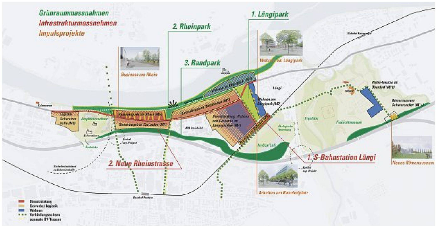
Salina Raurica, Pratteln/Augst: Massnahmenplan

lichen Vorstadt. Wie in Oerlikon hat sich auch hier die Schwerindustrie angesiedelt. Und wie beim Umbauprozess in Oerlikon bietet sich nun auch für Luzern Nord eine ähnliche Chance. Am Seetalplatz in Emmenbrücke, dem grössten Verkehrsknoten der ganzen Zentralschweiz, könnte etwas Vergleichbares in Gang kommen: zwischen Flussraum und Bahnhof Emmenbrücke könnte ein neues Stadtzentrum entstehen.