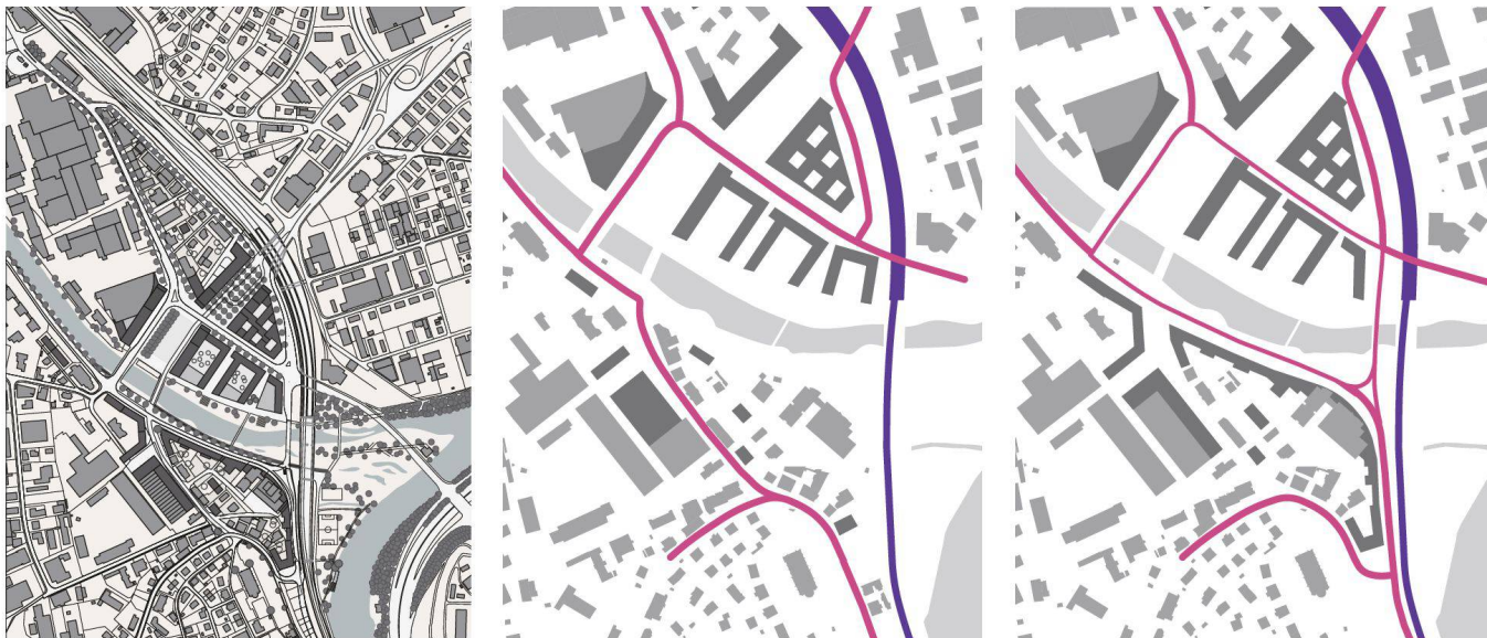
Zentrum Luzern Nord: Gesamtkonzept mit alternativer Verkehrsführung und Überbauung zwischen Bahnhof Emmenbrücke, Seetalplatz und Kleiner Emme sowie dem neuen Quai auf der Reussbühler Seite (links), Vorgegebene und alternative, inzwischen beschlossene MIV-Führung (mitte und rechts). – Auftraggeber: Kanton und Stadt Luzern, Gemeinden Emmen und Littau; Planungsteam: pool Architekten, Zürich, Berchtold.Lenzin Landschaftsarchitekten, Zürich, ewp Verkehrsplaner, Effretikon, Prof. Angelus Eisinger, Zürich; Testplanung 2008, Masterplan 2009–2010 mit Metron Raumentwicklung

as Es gibt einen Reiz, an etwas zu arbeiten, von dem man nicht genau weiss, wohin die Reise geht. Bei diesen Planungen sind wir zum Beispiel weit entfernt von den akribischen Raumprogrammen eines Wohnbauwettbewerbs. Vieles ist offener. Wir wissen in der Regel am Anfang eines solchen Prozesses nicht einmal, wie der nächste Planungsschritt aussehen könnte. Man kann das als Teil des Berufsbildes verstehen oder nicht, Tatsache ist, dass sich die Architektur sehr lange nicht zuständig fühlte für Planungsfragen. Jetzt, da die Zersiedelung vielerorts weit fortgeschritten ist, kann man sich fragen, ob man noch einsteigen will, weil die Misere ja schon angerichtet ist. Wir sehen es hingegen als Verpflichtung, dass es nicht einfach so weiterlaufen darf wie bisher.