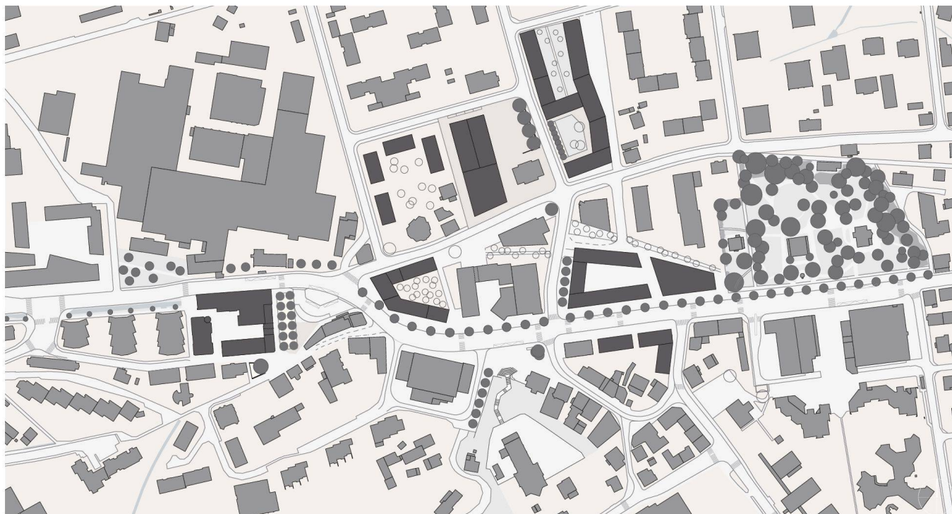
Richtplan Zentrum Kriens. – Auftraggeber: Gemeinde Kriens; Planungsteam: pool Architekten, Zürich, Berchtold.Lenzin Landschaftsarchitekten, Zürich, IBV Hüsliger Verkehrsplanung, Zürich; Dreistufiger öffentlicher Studienauftrag 2001–2002, Richtplan 2003–2004

as Ich sehe darin einen Paradigmawechsel, der in den letzten Jahrzehnten stattgefunden hat. Man kommt jetzt wieder auf Strategien der Stadterweiterung zurück, die vielleicht denjenigen von vor 100 Jahren gleichen, während die Schweizer Planer der Nachkriegszeit mit der konzentrierten Dezentralisation im Kopf alles unternommen haben, um die Siedlungsgebiete nicht zusammenwachsen zu lassen. Wenn man die Ballonaufnahmen von Eduard Spelterini vom Anfang des 20. Jahrhunderts betrachtet, fällt auf, wie am Beispiel von Zürich städtische Bauten in Erwartung von Wachstum mit grosser Selbstverständlichkeit auf damals noch unbebauten Flächen standen, weit ausserhalb der eigentlichen Kernstadt.