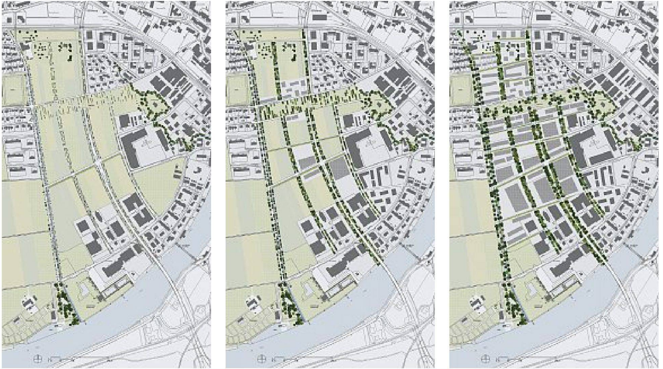
Masterplan Solothurn West: Entwicklungsperspektiven morgen, übermorgen, überübermorgen. – Auftraggeber: Stadt Solothurn, Stadtbauamt; Projektteam: agps.architecture, Zürich, Graf Stampfli Jenni Architekten, Solothurn, Hansjörg Gadiant Landschaftsarchitektur, Zürich; Offener Planungswettbewerb 2006–2007, Masterplan und Raumplanungsbericht 2007–2008, Teilzonenplanänderung und Erschliessungsplanung 2009–2010

gerade als Vorstadt bezeichnen kann, passt dieses Projekt gut in diese Diskussion. Die wachsende Mobilität auf allen Ebenen erlaubt es uns, den Bezug von Stadt und Vorstadt ganz anders zu denken. Im Falle von Solothurn handelt es sich um eine Stadt, die schon seit Jahrhunderten mit grosser Selbstverständlichkeit das Städtische pflegt, die nun aber zunehmend in den Einflussbereich anderer, grösserer Städte gerät. Das ist ein ganz anderer Fall als jene verstädterten Dörfer, deren Identität sich grundlegend verändert hat.