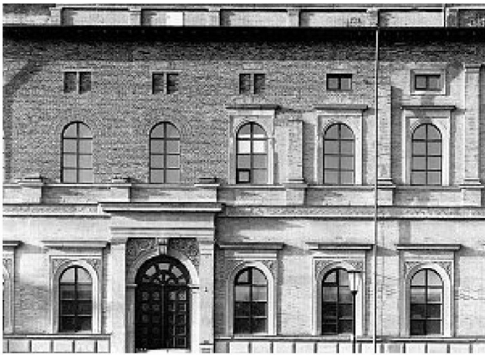
Bild aus: F. Peter / F. Wimmer, Von den Spuren, Döllgast (...), Salzburg/München 1998