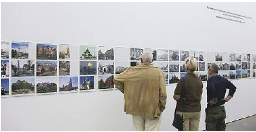
Abb. 1: Lange Bildreihen durchziehen die Wände der Münchener Ausstellung, die für die Erfindung einer angeblichen Tradition von Rekonstruktion Baudenkmäler a) auf ihren angeblichen Urzustand, b) ihren «Schadensfall» oder Totalverlust und c) auf ihren vollrekonstruierten Ist-Zustand reduzieren. Zwischenzustände und Alternativen fehlen ebenso wie zeitgeschichtliche Kontexte und eine Differenzierung der Interventionen wie u. a. jene von Wiederaufbau, Reparatur, Vollendung, Restaurierung und Konservierung.