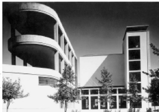
Casa Balilla in Trastevere, Rom 1933–1937