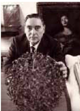
Luigi Moretti in einem Büro an der Piazza Santi Apostoli; im Vordergrund die Skulptur Sfera von Claire Falkenstein

In beiden Ausstellungen – in der Accademia di San Luca im Original, im MAXXI in Kopie – werden die Innenraumabgüsse aus Gips von St. Peter in Rom und weiteren bedeutenden Bauwerken gezeigt. Moretti setzte die ungefähr A4-grossen Gipsmodelle in seiner anfangs der Fünfzigerjahre eigens gegründeten Zeitschrift «Spazio» zur Illustration seiner Raumtheorie ein. Im Aufsatz «Strutture e sequenze di spazi» stellte er die Abgüsse als eine Art kognitiver Modelle dar, um dem Wesen des architektonischen Raums analytisch beizukommen. Diese Darstellung kann heute noch für das Verständnis des architektonischen Raums exemplarisch herangezogen werden – gerade im Unterricht. Sie bietet überdies eine mögliche Antwort auf die Frage, was Forschung in der Architektur sein könnte. Bei Moretti waren solche Untersuchungen in erster Linie wie erwähnt an die Ge-