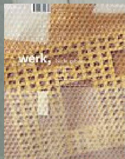
4|10 Nicht gebaut