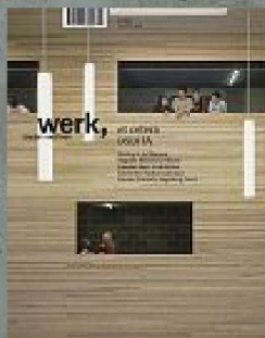
3|10 et cetera DSDHA