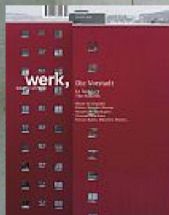
10|10 Die Vorstadt