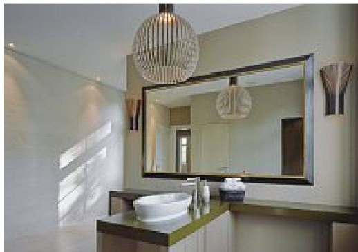
Bilder: Tom Bisig und Robert Beyer