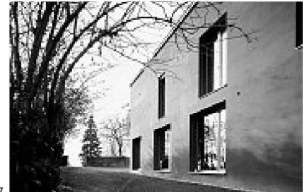
26 Trublerhütte Schlieren, 2007 Mark Aurel Wyss, Zürich, Rossetti+Wyss Architekten