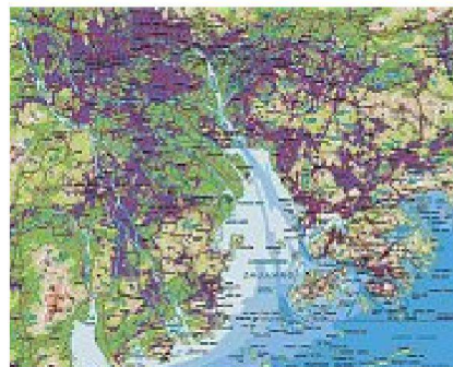
Rasantes Wachstum der Städte im Pearl River Delta, Stand 2002 und 2007; urbane Landwirtschaft in China.