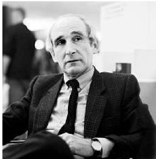
Porträt anlässlich des «Forum kreativer Fabrikanten» an der Schweizer Möbelmesse, Bern 1987