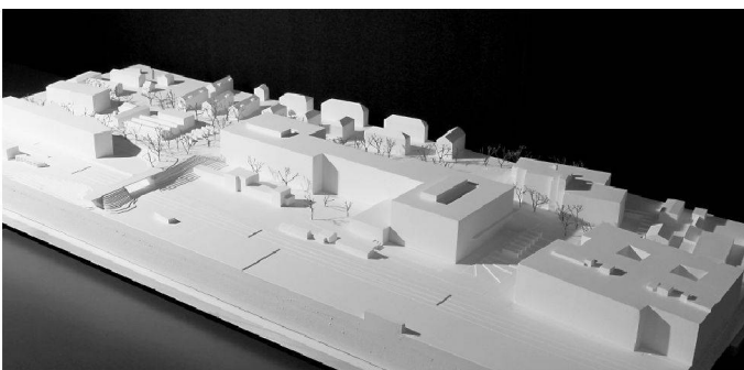
Büro 8 Architekten, Bern, 4. Rang