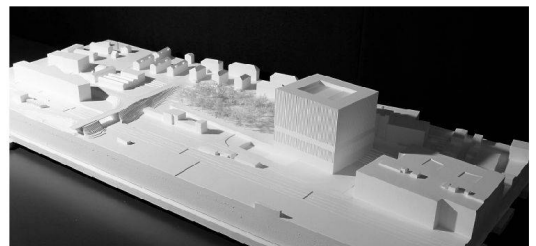
Pool Architekten, Zürich, 1. Rang