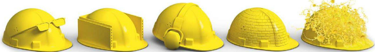
Planung &amp; Ausführung