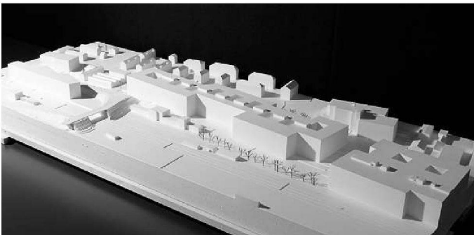
Graber Pulver Architekten, Zürich, 3. Rang