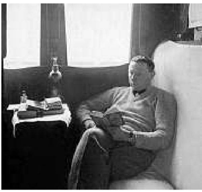
Ernst May in seinem Eisenbahnabteil in der UdSSR, 1931