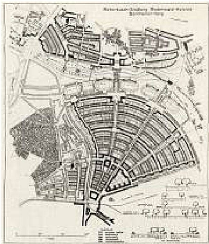
Bebauungsplan Riederwald, Rotenbusch und Bornheimer Hang in Frankfurt, 1926/27