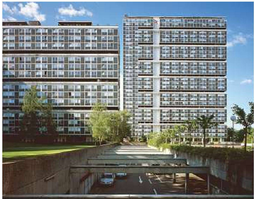
Cité du Lignon 2010