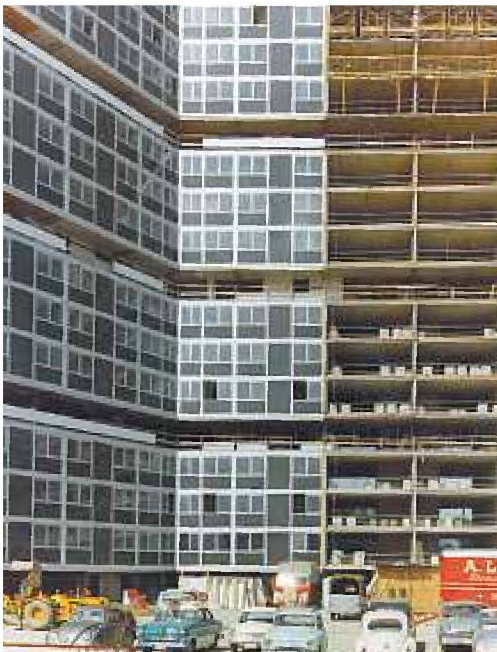
Cité du Lignon, Baustelle um 1967, Montage der Aussenhülle, Foto Alusuisse