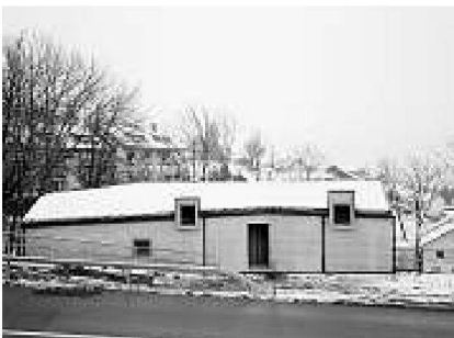
29 Pavillon 5, Ecole secondaire de la Broye, Estavayer-le-lac, 2010 Marc Widmann, Genève, Widmann-Fröhlich architectes