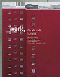
10|10 Die Vorstadt