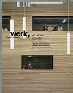
3|10 et cetera DSDHA