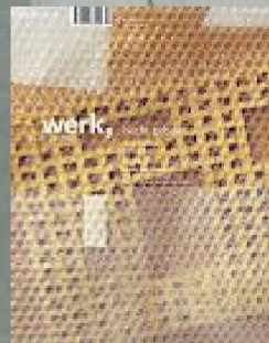
4|10 Nicht gebaut