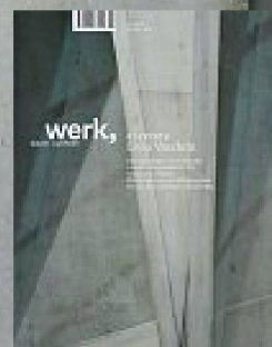
11|10 et cetera Livio Vacchini